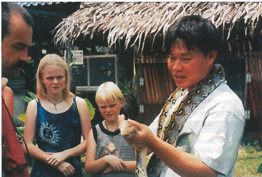
De mishandelde python.

Ik bracht, zoals gezegd, eerst een bezoek aan de plaatselijke slangenfarm. Hier worden de slangen van het eiland voorgesteld aan het toeristische publiek. Natuurlijk worden toeristen getraceerd op een show met cobra's, in dit geval met Naja siamensis . Maar ook Elaphe radiata en Boiga dendrophila melanota mochten optreden. Omdat ik, méér dan de gemiddelde toerist dat zal zijn, geïnteresseerd ben in slangen, vroeg ik de slecht Engels sprekende Thai dan ook of ik iets meer kon zien dan de anderen. Hierop kreeg ik een kijkje achter de schermen van deze 'farm'. Daaruit bleek dat men zich tot doel had gesteld de slangen van Phuket te beschermen en waar nodig voorlichting te geven aan de plaatselijke bevolking.